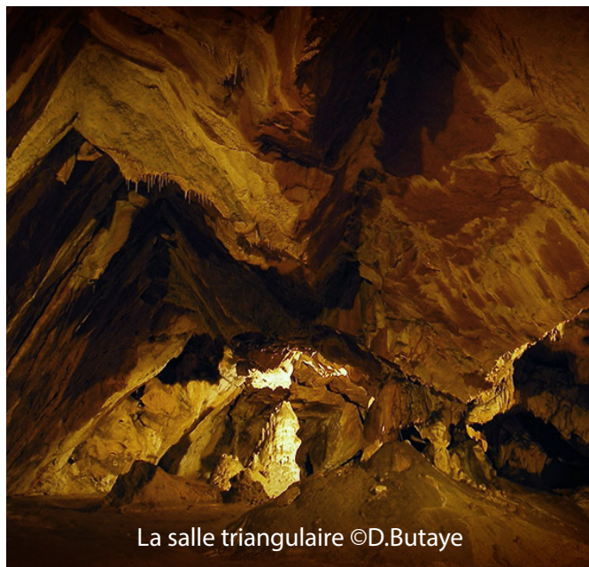
La salle triangulaire

6 / L'hiver : L'étude des ossements d'animaux démontre une occupation hivernale de la grotte, d'octobre à juin.