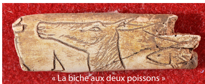
« La biche aux deux poissons »