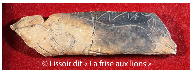
© Lissoir dit « La frise aux lions »